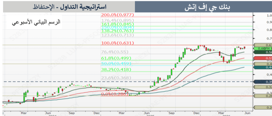
استراتيجية التداول - الإحتفاظ

ارتد المؤشر من مستوى الدعم الرئيسي عند 1865 نقطة، حيث يتداول حالياً فوق المتوسطات المتحركة لـ 20 و50 و100 أسبوع (يحوم حول مستوى المقاومة عند 1985 نقطة)، مما يشير إلى نظرة فنية إيجابية على المدى المتوسط. يتطلب تأكيد الاتجاه الصعودي اختراقاً واضحاً ومستداماً لمستوى المقاومة المباشر عند 1985 نقطة، مما يفتح المجال أمام مستويات مقاومة لاحقة عند 2020 ثم 2055 نقطة. وقد يؤدي استمرار الزخم الصعودي إلى إعادة اختبار القمة السابقة قرب مستوى 2085 نقطة على المدى القصير إلى المتوسط. لتحقيق اختراق مستدام فوق مستوى المقاومة، نحتاج إلى زيادة ملحوظة في حجم التداول لتأكيد التزام المشترين والإشارة إلى بداية اتجاه الصعود من جديد. نصح المتداولون بانتقاء الأسهم المتفوقة في الأداء.