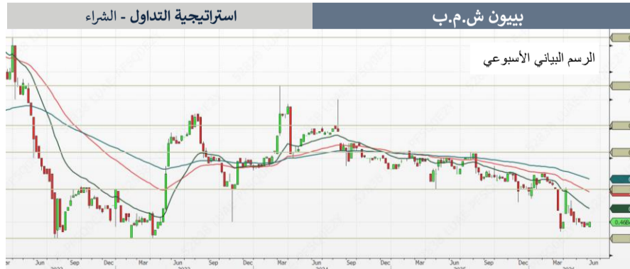
استراتيجية التداول - الشراء

ارتد السهم من المستوى الموصى به عند 0.485 دينار بحريني، ويتداول حالياً بالقرب من أعلى مستوى سابق له عند 0.63 دينار بحريني، مما يعكس تحسناً في زخم السوق على المدى القريب. من المرجح أن يؤدي الاختراق الحاسم فوق مستوى 0.63 دينار بحريني إلى وجود تحرك صاعد متجهاً نحو مستوى المقاومة التالي عند 0.713 دينار بحريني، مع إمكانية تحقيق المزيد من الارتفاع متجهاً نحو المقاومة التالية عند 0.763 دينار بحريني على المدى القصير إلى المتوسط. لتحقيق اختراق مستدام (تجاوز مستوى 0.63 دينار بحريني)، يلزم ارتفاع ملحوظ في أحجام التداول لتأكيد ثقة المستثمرين واستمرار الاتجاه الصعودي. يُنصح بالاحتفاظ بالسهم مع وضع مستوى وقف الخسارة دون مستوى الدعم عند 0.57 دينار بحريني.