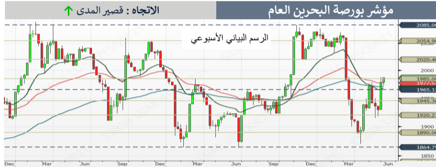
الاتجاه : قصير المدى ↑